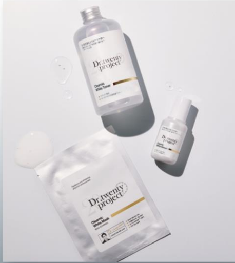
※1 アスコルビン酸(皮膚コンディショニング剤) ※2 皮膚コンディショニング剤 ※3 キメの整った肌印象のこと ※4 乾燥による

ビタミンC ※1 やナイアシンアミド ※2 配合の クリアニックホワイトシリーズ。 お肌にうるおいを与え、透明感 ※3 のあるツヤ肌に導きます。 くすみ ※4 にお悩みの方におすすめです。